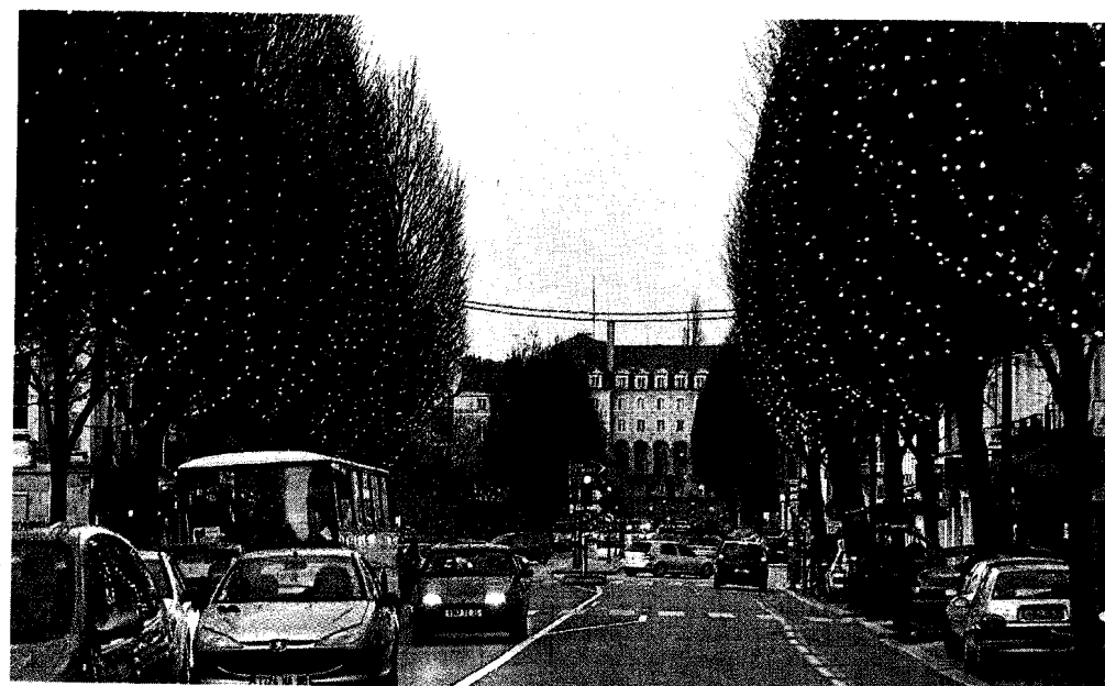
Le palais Saint-Georges est resté éteint hier. Toutes les guirlandes de Noël branchées sur secteur ont été allumées plus tard. Celles raccordées au réseau public, comme ici, n'ont pu être intégrées à cette mesure d'économie.

Seront-elles suffisantes pour éviter une coupure ? Du côté de RTE, on prévient qu'il n'y a pas de petites économies. Les mesures prises dans les différentes villes de l'Ouest ont eu un réel impact mardi soir sur le réseau électrique. Hormis Rennes, des villes plus petites comme Pacé (lire ci-dessous) ou Saint-Erblon ont éteint les